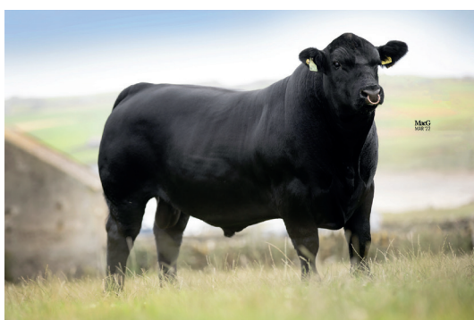
Býk: SKAILL DALTON W214