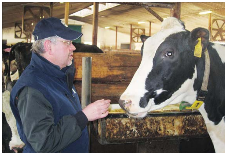
„Celý systém přípařování GMS mě tak nadchnul, že jsem si v říjnu 1996 udělal hodnotitelský kurs a od té doby si exteriér krav hodnotím sám.“

K další významné změně došlo v roce 2008, kdy jsme do provozu uvedli novou halu pro krávy stojící na suchu a krávy na konci laktace. To nám umožnilo postupně navýšit počet krav na současných 525. Z toho je 33 % krav na první, 30,5 % na druhé, 21,7 % na třetí laktaci a zbylých 14,8 % na čtvrtých a vyšších laktacích. Průměrné pořadí laktace živých krav je 2,3 při průměrném laktacním dni pod 190. Máme radost i z toho, že se nám daří v průměru jalovice telit ve 23,26 měsíce věku. Poslední čtyři roky si inseminujeme sami, střídáme se s kolegou Františkem Nevošádem. Denní dodávka mléka na ustájenou krávu dosahuje téměř 30 kilogramů, tak-