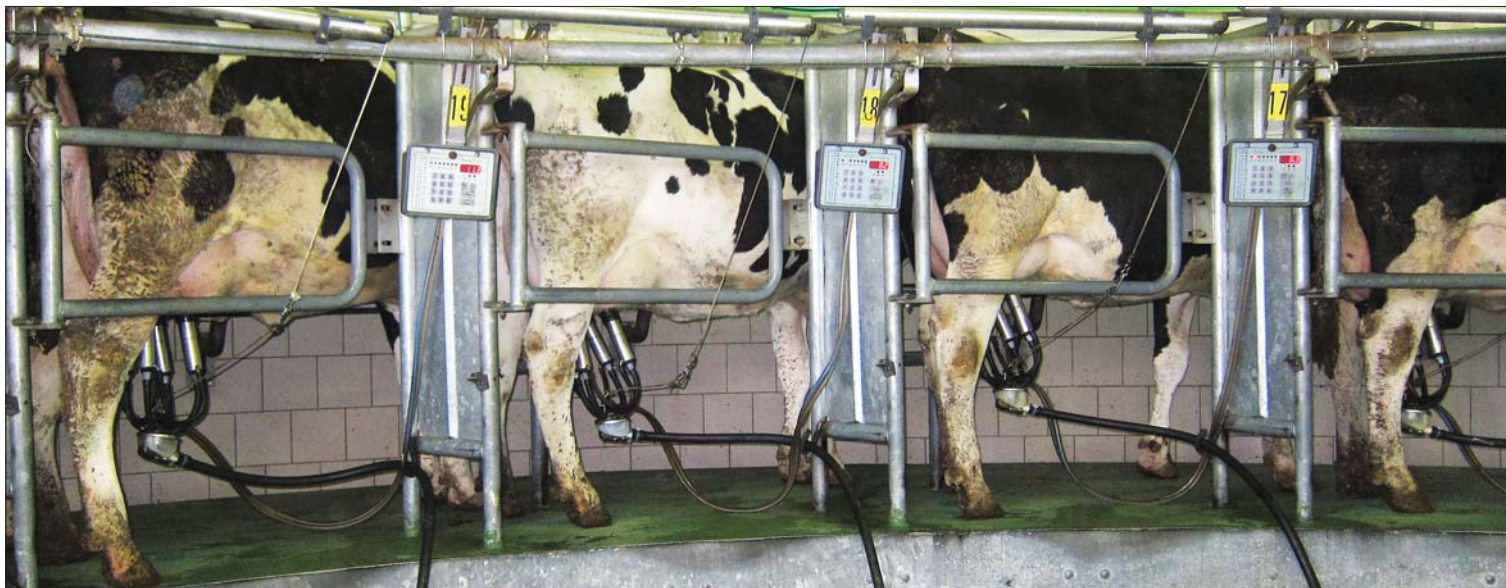
Vyrovnanost vemen usnadňuje a urychluje práci v dojírně