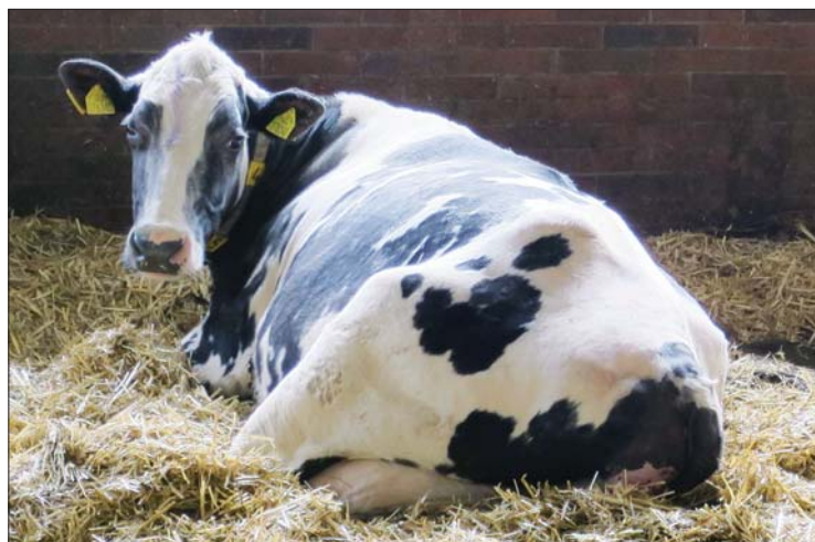
Nejstarší kráva Cilka po býkovi Mr. Moon je na 12. laktaci a má nadojeno přes 135 tisíc kilogramů mléka