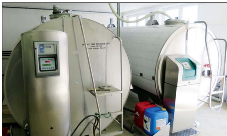
Posledním zlepšením, které jsme v březnu uvedli do provozu, je zrekonstruovaná mléčnice s navýšenou kapacitou pro skladování i chlazení mléka včetně rekuperace pro úsporu nákladů

z nich Cilka po býkovi Mr. Moon je na 12. laktaci a má nadojeno přes 135 tisíc kilogramů mléka. Druhá nejstarší, Běta po býkovi Joke, je na 10. laktaci a nadojila přes 118 tisíc kg mléka. Poslední je Lidka po býkovi Jalapeno, která je na 9. laktaci a má nadojeno přes 104 tisíc kilogramů mléka.