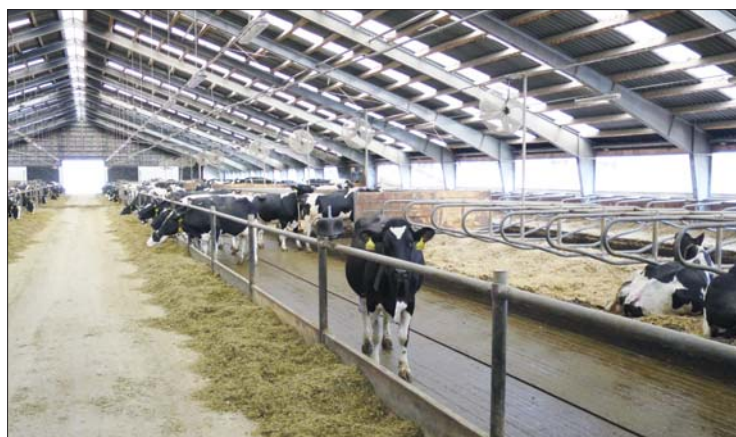
Do kravinů jsme nainstalovali ventilátory v kombinaci s mlžením a díky tomu přes léto udržíme vyšší nádoje i lepší zabřezávání

opatření a změny pro zvýšení pohody a zároveň výkonnosti krav na našich farmách. Brakace byla zaměřena hlavně na kusy s opakujícími se zdravotními problémy a časté přebíhalky. Jelikož jsme zároveň s tím chtěli udržet stavy, rozhodli jsme se v několika vlnách nakoupit vysokobřeží jalovice. Dnes už si můžeme popravdě říci, že takto nakoupené jalovice neprokázaly přínos, jaký jsme čekali. Některé nezvládly přechod do našich stájí, zejména kon-